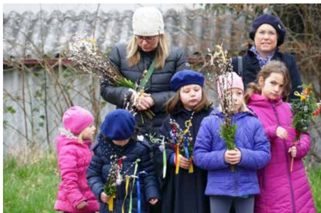
Palmsonntag in Glanzing