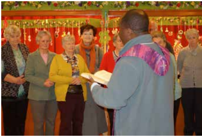
Ostermarkt in der Krim