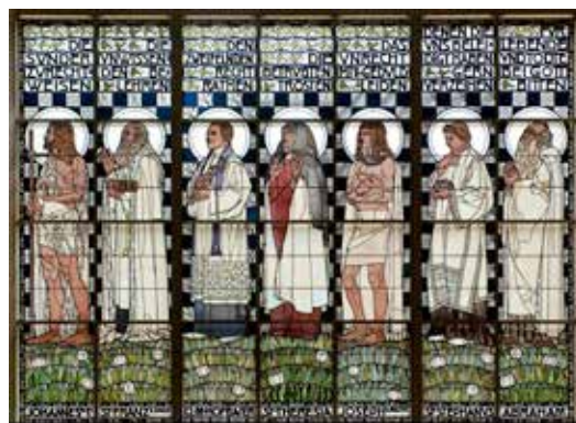
Werke der Barmherzigkeit in der Jugendstilkirche am Steinhof

Franz von Sales schrieb einmal: „Wer das Herz des Menschen gewonnen hat, besitzt den ganzen Menschen.“ Die Sprache der Predigt, der geistlichen Begleitung oder des Gebetes soll seiner Meinung nach eine Sprache „von Herz zu Herz“ sein. Gottesbeziehung ist für ihn keine Kopfsache, sondern Herzensangelegenheit und Herzensbeziehung: Ich schenke Gott mein Herz, weil er mir sein Herz geschenkt hat. Das sind salesianische Grundsätze, die durchaus im praktischen Leben einer Pfarrgemeinde konkret werden könnten. Eigentlich ist eine jede und ein jeder dazu eingeladen, einmal darüber nachzudenken, wie sie oder er dazu beitragen kann, dass die Pfarre Franz von Sales eine Pfarre mit Herz wird.