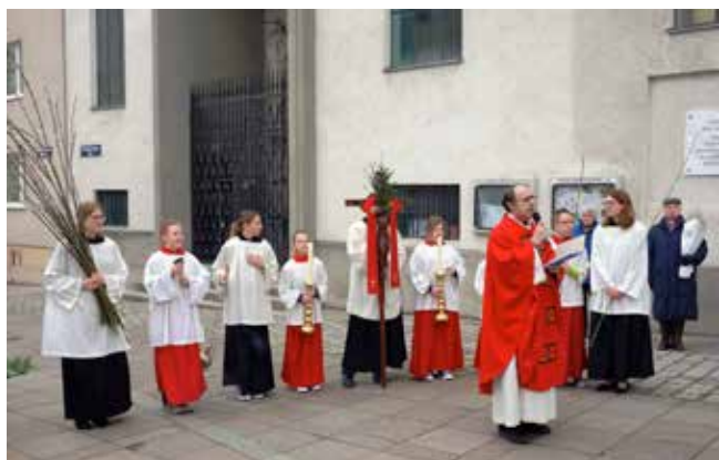
Palmsonntag in der Krim