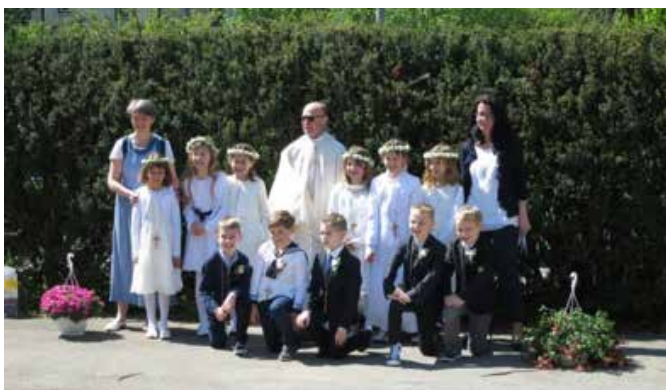
Erstkommunion in Glanzing 30.04. & 01.05.

Viele weitere Fotos finden Sie auch zum Herunterladen auf der Homepage der Pfarre Franz von Sales www.franzvon-sales.at