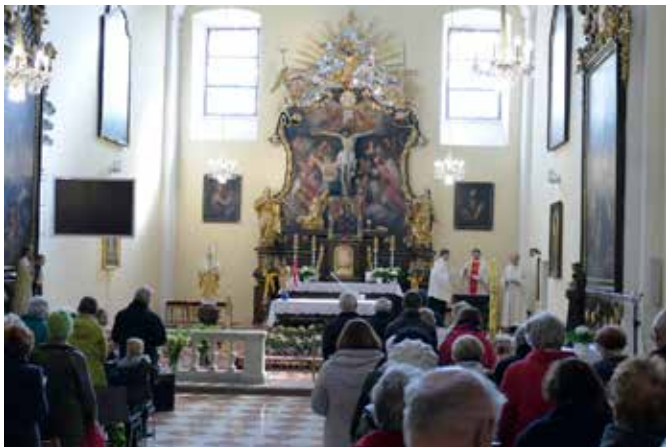
Gemeinsamer Emmausgang am Kahlenberg