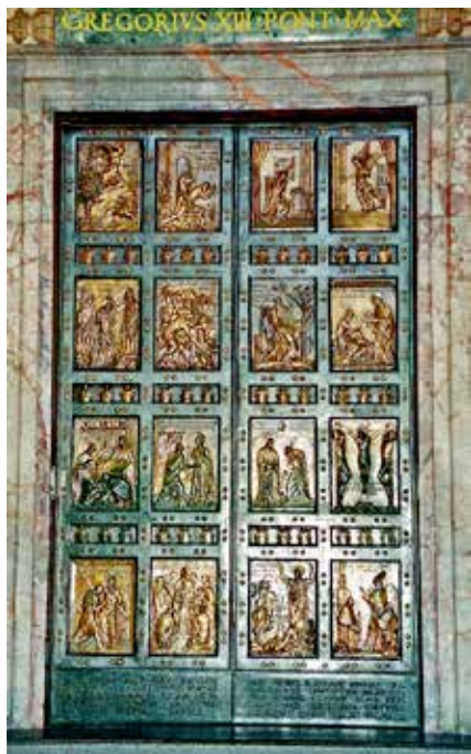
Foto: Heilige Pforte Petersdom

Selten hat ein „Heiliges Jahr“ so viel Echo ausgelöst, wie das „Jahr der Barmherzigkeit“, das von Papst Franziskus am 8. Dezember 2015 im Petersdom in Rom eröffnet wurde. Offenbar hat der Papst mit dem Thema „Barmherzigkeit“ einen Nerv getroffen, der die Menschen von heute in aller Welt bewegt.