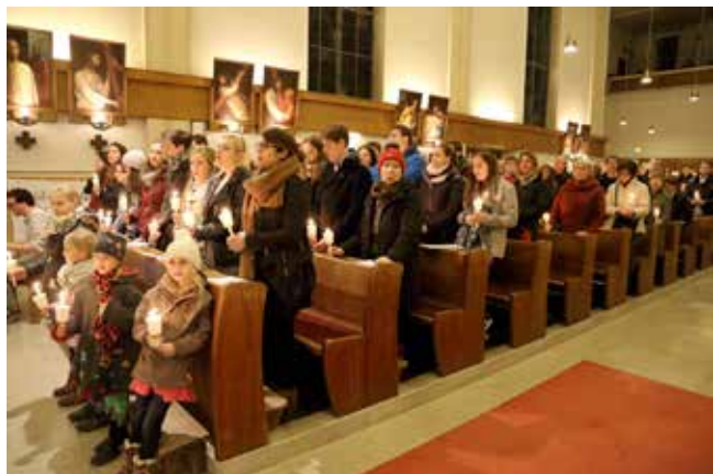
Osternacht in der Krim