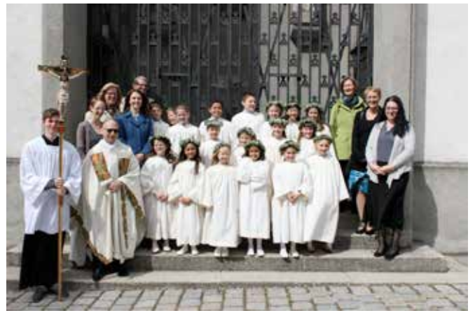
Erstkommunion in der Krim