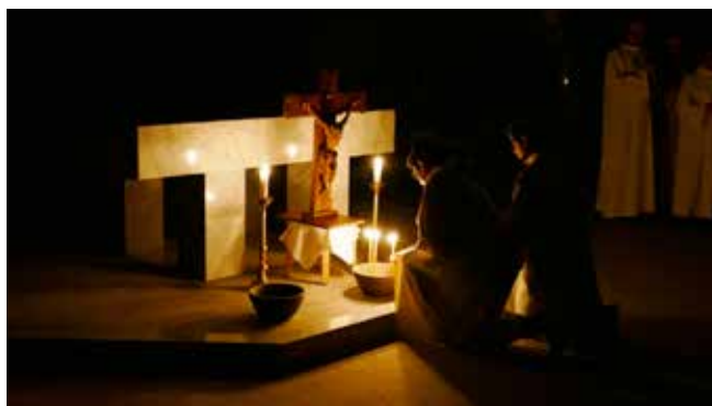
Ostermorgen in Glanzing