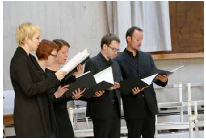
Madrigalkonzert nach der Hl. Messe in Glanzing