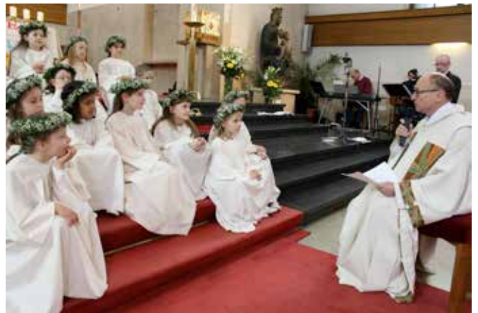
Erstkommunion in der Krim